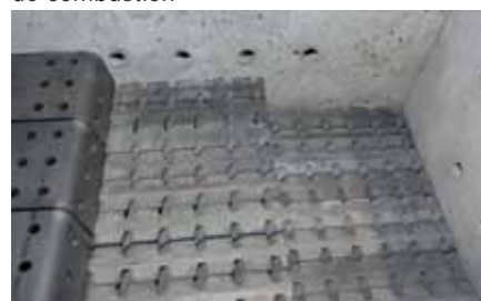
Cámara de combustión con revestimiento macizo refractario y parrilla de grandes dimensiones.