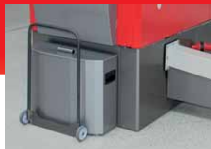
Caja de cenizas grande con ruedas para un cómodo vaciado