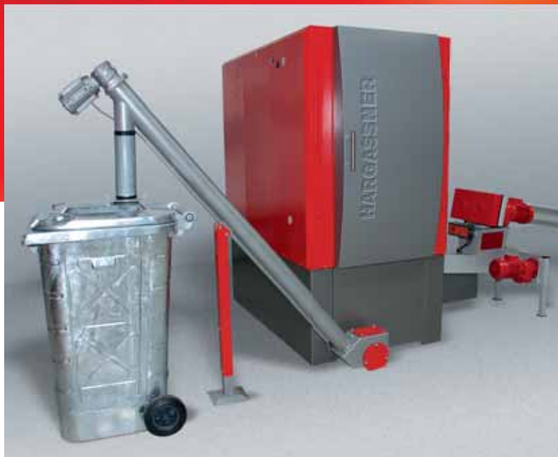
Descarga automática de cenizas con sinfín diagonal hasta el depósito de cenizas de 240 l