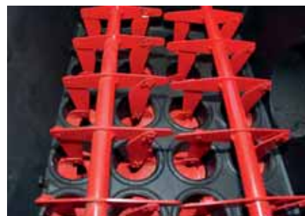
Limpieza del intercambiador de calor totalmente automatizada